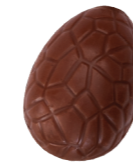
199 ■ 9 g - 1,5 kg Bananencrème Crème de banane Banana cream