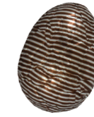
213 ■ 9 g - 2 kg Hazelnotpraliné Praliné aux noisettes Hazelnut praliné