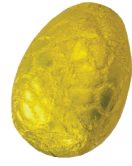
224 ■ 9 g - 2 kg Bananencrème Crème de banane Banana cream