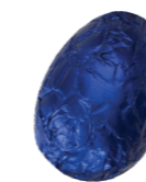
226 ■ 9 g - 2 kg Melkchocolade Chocolat au lait Milk chocolate