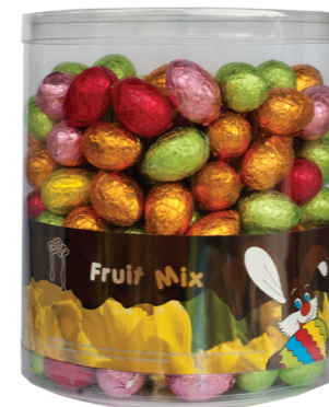
220 MIX 9 g - 2 kg Mix assortiment van crèmes Assortiment mixte de crèmes Mix assortment creams