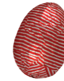
215 ■ 9 g - 2 kg Praliné krokant Praliné croustillant Praliné crispy