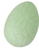
156 ■ 9 g - 1,5 kg Krokante witte chocolade met natuurlijk groen Chocolat blanc croustillant au vert naturel Crispy white chocolate with natural green