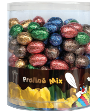
210 MIX 9 g - 2 kg Mix assortiment met praliné en praliné krokant Assortiment mixte avec praliné et praliné croustillant Mix assortment with praliné and crispy praliné