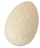
154 ■ 9 g - 1,5 kg Hazelnotpraliné Praliné aux noisettes Hazelnut praliné