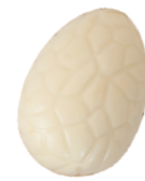
161 ■ 9 g - 1,5 kg Advocaatcrème Crème d'avocat Egg liqueur cream