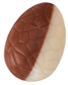
157 ■ 9 g - 1,5 kg Domino melk / wit met praliné Domino lait / blanc au praliné Domino milk / white with praliné