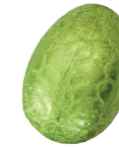
225 ■ 9 g - 2 kg Pistachecrème Crème de pistache Pistachio cream