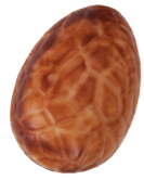
155 ■ 9 g - 1,5 kg Hazelnotpraliné Praliné aux noisettes Hazelnut praliné