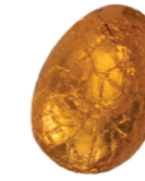
222 ■ 9 g - 2 kg Vanillecrème Crème à la vanille Vanilla cream