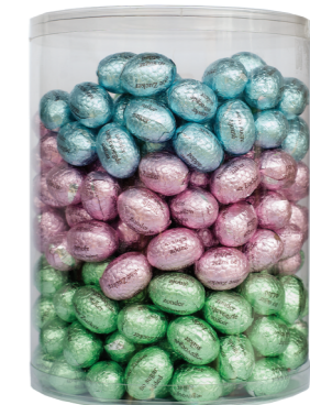
3024 MIX SV No sugar added 8 g - 2 kg Paaseitjes zonder toegevoegde suikers, met praliné Assortiment œufs de Pâques sans sucres ajoutés au praliné Assortment of Easter eggs without added sugar with praliné