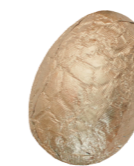
227 ■ 9 g - 2 kg Fondantchocolade Chocolat noir Dark chocolate