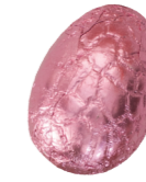
223 ■ 9 g - 2 kg Frambozencrème Crème de framboise Raspberry cream