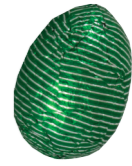
214 ■ 9 g - 2 kg Praliné krokant Praliné croustillant Crispy praliné