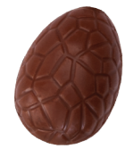
159 ■ 9 g - 1,5 kg Praliné krokant Praliné croustillant Crispy praliné