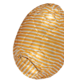
211 ■ 9 g - 2 kg Hazelnotpraliné Praliné aux noisettes Hazelnut praliné