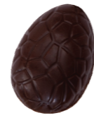
197 ■ 9 g - 1,5 kg Praliné met koffiesmaak Praliné au saveur de café Praliné with coffee flavor