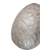
228 ■ 9 g - 2 kg Witte chocolade Chocolat blanc White chocolate